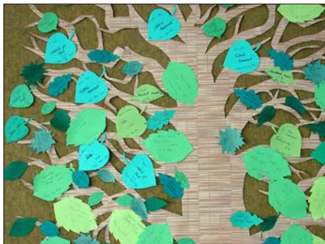
Virtsu õpilaste lugemispuu

Emakeele päeva raames plaanisime Virtsu koolis lugeda näidendit ja lindistada seda. Aga kuna algasid olümpiaadid, lükkub asi kevadepoole edasi. Kömsi kooli õpetajatele ja lastele tutvustatakse uudiskirjandust. Lasteraamatupäeva raames meisterdatakse Vatla kooli lastega lemmikraamatut ja kirjutatakse sinna