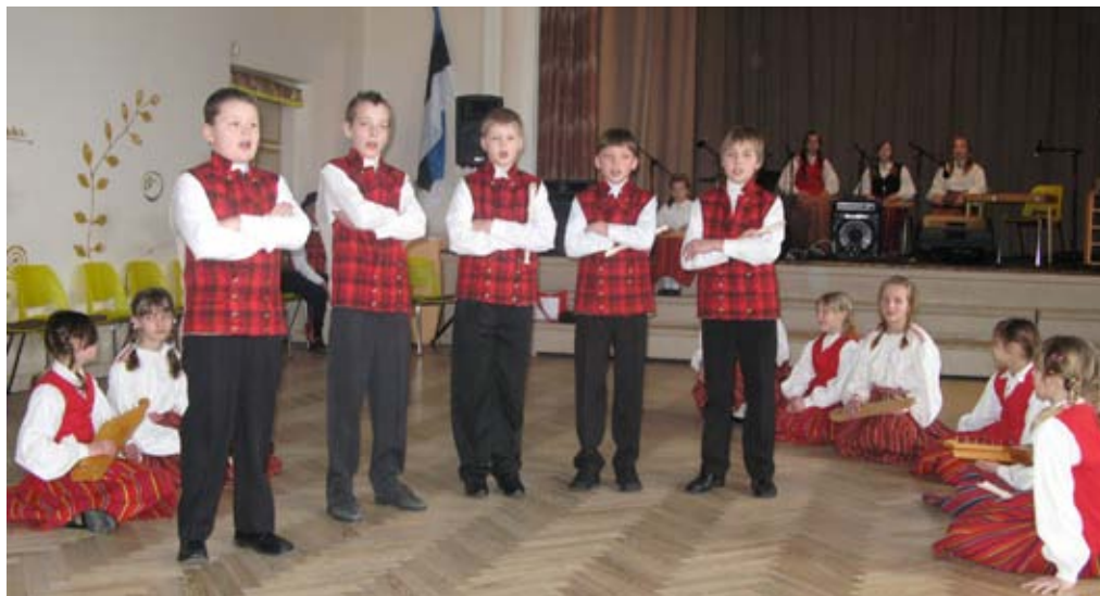
Lasterühm "Kullerkupud".